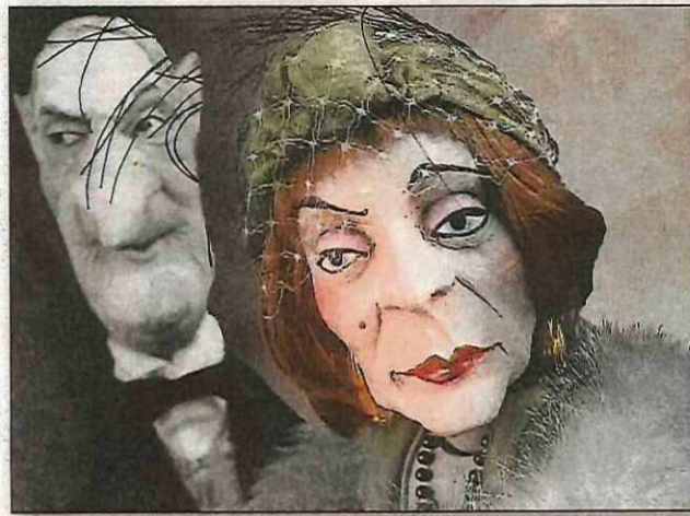
Auch der Dürrenmatt-Klassiker „Der Besuch der alten Dame“ wird beim Lübelner Marionettenfestival, das am Freitag beginnt, gezeigt. A.: Hohenloher Figurentheater

schon vorher alle Häuser mit Marionetten und anderen Theaterfiguren dekoriert, überall soll es für die Besucher des Rundlingsmuseums etwas zum Entdecken und